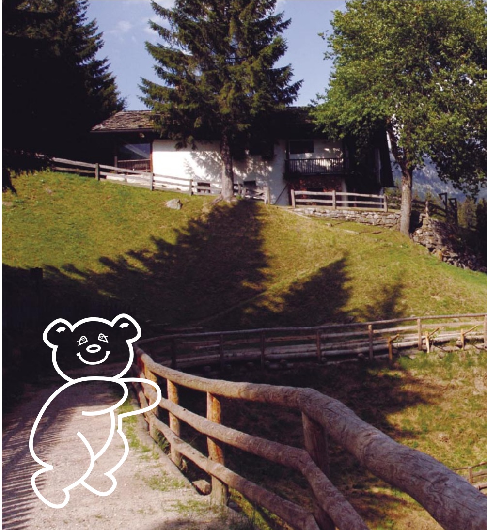
“Sentiero dell’Orso” dell’itinerario Dolomiti Brenta Bike. “Sentiero dell’Orso” (Bear’s Path), part of the Dolomiti Brenta Bike itinerary. “Sentiero dell’Orso” (Bär Pfad) Route der Brenta-Dolomiten Bike.