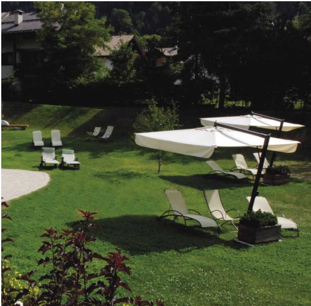
Hearty activity / Herzliche Aktivität